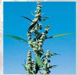
Weisser Gänsefuss Sehr vielästiger Blütenstamm