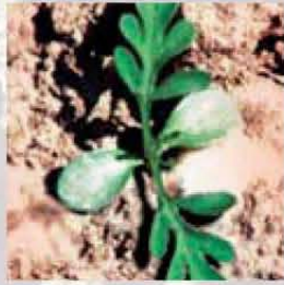
Ambrosia artemisiifolia Keimblätter sind fleischig und gestielt. Bei den ersten Blättern Form und Anzahl der Fiederblättchen beachten.