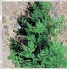
Einjähriger Beifuss Blatt entwickelt beim Zerreiben starken Duft