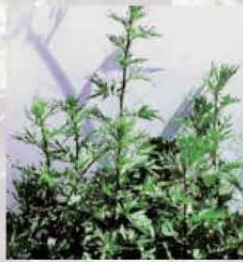
Gemeiner Beifuss Blattunterseite silbrig-weiss und flaumig